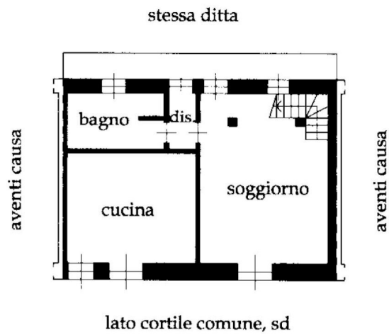
PIANTA PIANO PRIMO H:2,70 mt.